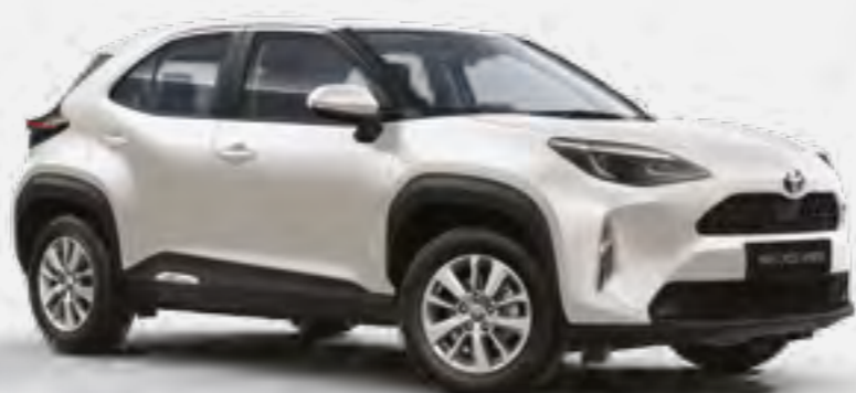
לבן פנינה מטאלי 089