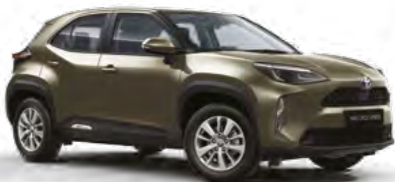
ברונזה מזהב מטאלי 6X1