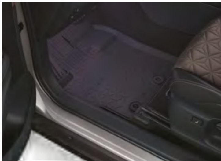
שטיחי גומי המגנים על פנים הרכב מפני לכלוך מבחוץ וניתנים להסרה לניקוי קל ופשוט