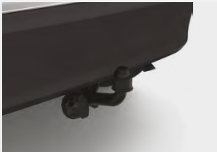
וו גרירה קבוע*