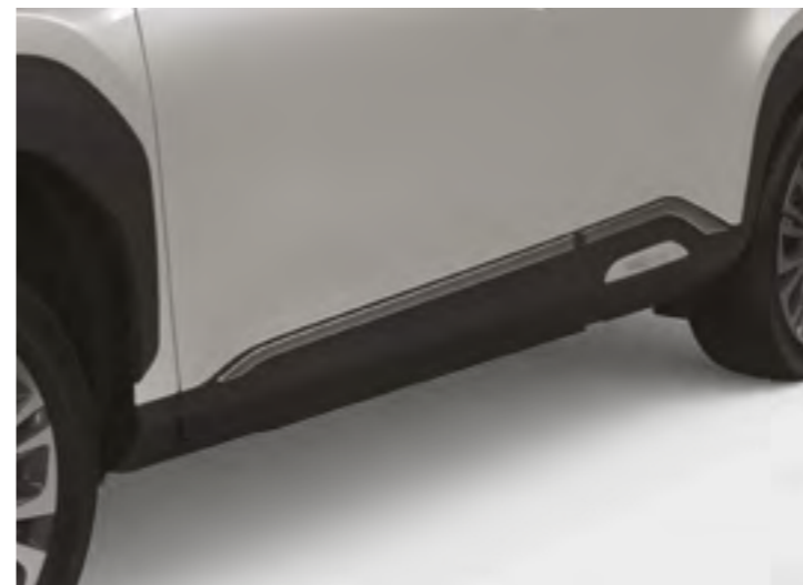
הוסיפו פס קישוט כרום לדלתות, והעניקו לרכב מראה עוצמתי לנגיעה נוספת של סטייל המותאם למראה של העיר