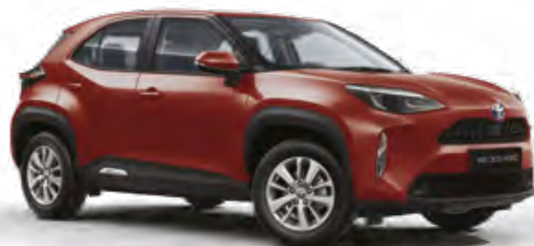
אדום מטאלי 3U5