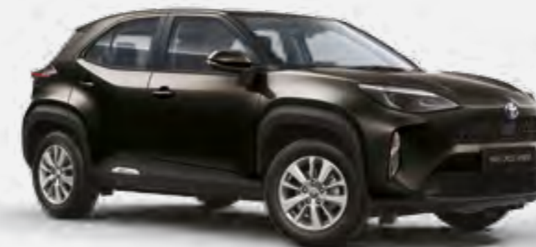
שחור מטאלי 209