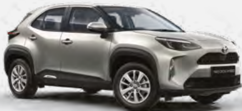
כסוף מטאלי 1L0