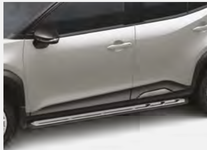
מדרגות צד המעצימות את המראה המחוספס של הרכב. שבנוסף מסייעות להגיע לגג הרכב בצורה קלה ופשוטה יותר