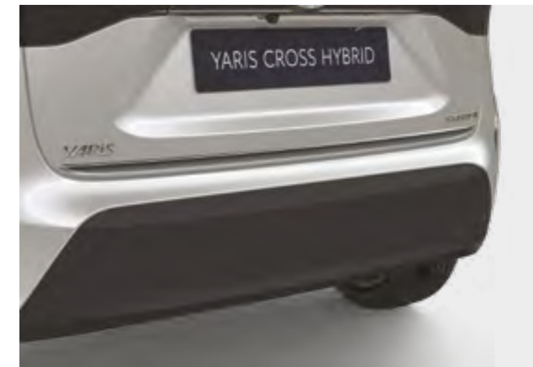
הוסיפו קישוט כרום המדגיש את עיצוב הפגוש האחורי ומבליט את המראה הייחודי של הרכב