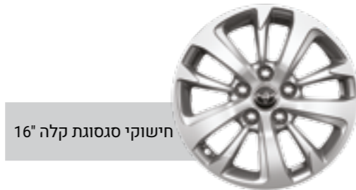
חישוקי סגסוגת קלה 16"