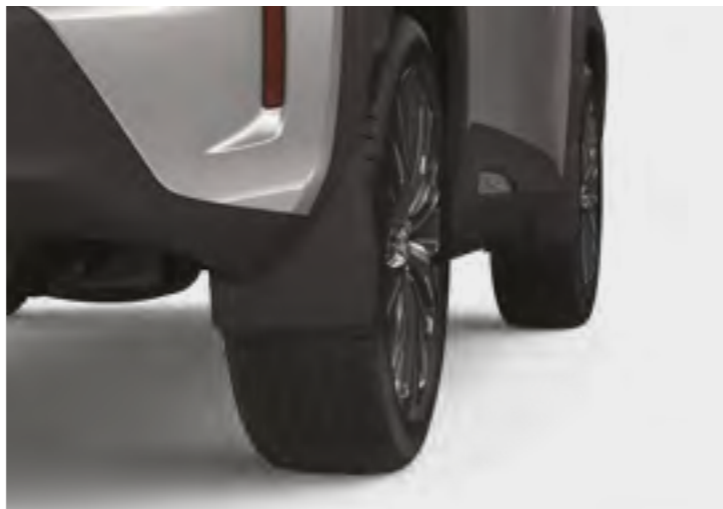
סט מגיני בוץ קדמיים ואחוריים, שיעזרו למזער כתמי מים ובוץ על הרכב