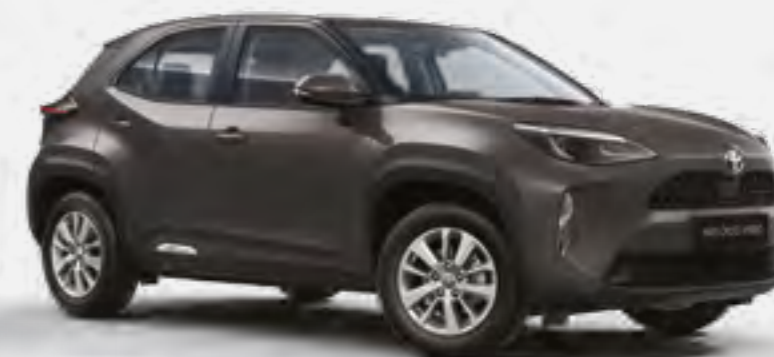
אפור כהה מטאלי 1G3