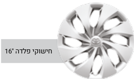
חישוקי פלדה 16"

*מומלץ לבדוק את תאימות הטלפון הנייד שברשותך למערכת ה-Bluetooth המותקנת ב-YARIS CROSS. את הבדיקה ניתן לעשות בלינק הבא: www.toyota-tech.eu/bluetooth/search.aspx **נכון למועד פרסום קטלוג זה, אפליקציית Android Auto אינה זמינה בישראל. ***פעילות ה-E-Call תלויה ברשת הסלולרית הנמצאת בקרבת הרכב בעת שידור המידע.